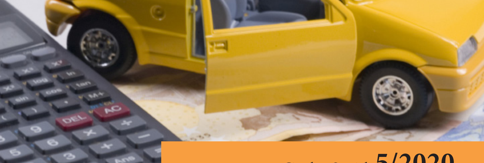
Tabelle ACI dei costi chilometrici 2020

Nella Gazzetta Ufficiale 31.12.2019, n. 305 (supp. ord. n. 47) sono state pubblicate le “Tabelle nazionali dei costi chilometrici di esercizio di autoveicoli e motocicli elaborate dall’Aci”, in vigore dal 1.01.2020.